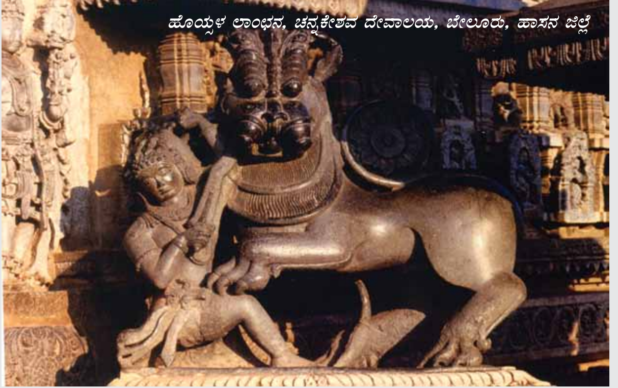
ಹೊಯ್ಸಳ ಲಾಂಛನ, ಚನ್ನಕೇಶವ ದೇವಾಲಯ, ಬೇಲೂರು, ಹಾಸನ ಜಿಲ್ಲೆ

ಕರ್ನಾಟಕದ ಇತಿಹಾಸ ಪುಟಗಳಲ್ಲಿ ಹೊಯ್ಸಳರು, ಬಲಿಷ್ಠ ಅರಸರಾಗಿ ಮಾತ್ರವಲ್ಲ, ಕರ್ನಾಟಕದ ಸಂಸ್ಕೃತಿ ಹಾಗೂ ಕಲೆಗಳಿಗೆ ಆಶ್ರಯದಾತರಾಗಿ ಅಮರರಾಗಿದ್ದಾರೆ. ಸ್ವತಂತ್ರ ಹೊಯ್ಸಳ ಸಾಮ್ರಾಜ್ಯದ ಬುನಾದಿಯನ್ನು ಹಾಕುವುದಲ್ಲದೆ, ಕನ್ನಡ ಸಂಸ್ಕೃತಿಯು ಅರಳುವಲ್ಲಿ ಚಾಲನಾ ಶಕ್ತಿಯನ್ನು ವಿಷ್ಣುವರ್ಧನನು ನೀಡಿದನು. ಈ ರಾಜವಂಶದ ಹೆಸರನ್ನು ಹೊತ್ತ ವಾಸ್ತು ನಿರ್ಮಾಣ ಶೈಲಿಯು ಈ ಅವಧಿಯಲ್ಲಿ ವೃದ್ಧಿಯಾಯಿತು. ಆತನಿಗೆ ಯೋಗ್ಯಳಾದ ಸತಿ ಶಾಂತಲಾ, ಸಂಸ್ಕೃತಿ ಹಾಗೂ ಕಲೆಗಳೇ ಮೈವೆತ್ತಂತಿದ್ದಳು. ಈ ಕಾಲವು ಪೌರುಷಕ್ಕೆ ಮುಡಿಪಾಗಿಟ್ಟ ಕಾಲವಾಗಿತ್ತು - ಲೆಂಕರು, ಅಂಕಕಾರರು, ವೇಳೆವಾಳಿಗಳು, ಹಾಗೂ ಗರುಡರಂತಹ ವಿವಿಧ ವರ್ಗದ ವೀರ ಯೋಧರು, ತಮ್ಮ ಒಡೆಯರಿಗೆ ತೋರಿದ ಅಚಲವಾದ ಶ್ರದ್ಧೆ ಹಾಗೂ ಸ್ವಾಮಿನಿಷ್ಠೆಯು ಅವರವರ ಜೀವವನ್ನೇ ಆಳರಸರಿಗೆ ಮುಡಿಪಾಗಿಡುವ ಮೂಲಕ ಪರಾಕಾಷ್ಠೆ ತಲುಪಿತು. ಅತ್ಯಂತ ಜನಪ್ರಿಯ ಧರ್ಮಗಳಾದ ಜೈನ, ಶೈವ, ವೈಷ್ಣವ, ಇತ್ಯಾದಿ ಮತಗಳು, ಸಹಬಾಳ್ವೆಯಿಂದ ಏಳಿಗೆ ಹೊಂದಿ, ರಾಜಾಶ್ರಯವನ್ನು ಪಡೆಯುವ ಮೂಲಕ, ಧಾರ್ಮಿಕ ಸಹಿಷ್ಣುತೆ ಮೆರೆದು, ಈ ಕಾಲಘಟ್ಟದ ಹೆಗ್ಗುರುತಾಗಿ ಮೂಡಿತು.