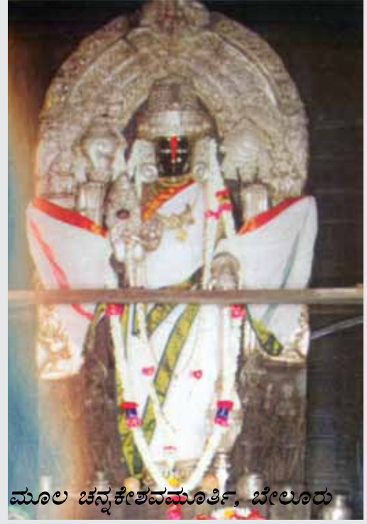
ಮೂಲ ಚನ್ನಕೇಶವಮೂರ್ತಿ, ಬೇಲೂರು