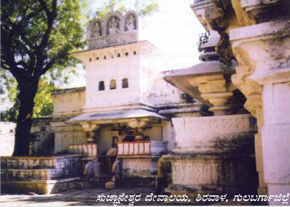
ಸುಜ್ಞಾನೇಶ್ವರ ದೇವಾಲಯ, ಶಿರವಾಳ, ಗುಲಬರ್ಗಾಜಿಲ್ಲೆ

ಪ್ರತಿಷ್ಠೆಯನ್ನು ಡೆಕ್ಕನ್ ಪ್ರಾಂತ್ಯವು ಅನುಭವಿಸಲಿಲ್ಲ. ಭಾರತದಲ್ಲಿ ಅತ್ಯಂತ ಭಯಭೀತಿ ಹುಟ್ಟಿಸಿದ ಅರಸರೆನ್ನುವ ರಾಷ್ಟ್ರಕೂಟ ಸಾಮ್ರಾಜ್ಯವು ವಿಶ್ವದ ನಾಲ್ಕು ಮಹಾನ್ ಸಾಮ್ರಾಜ್ಯಗಳ ಪೈಕಿ ಒಂದೆಂದೂ, ಕ್ರಿ.ಶ.೮೫೧ರಲ್ಲಿ ಬಂದಿದ್ದ ಅರಬ್ಬಿ ಯಾತ್ರಿಕ ಸುಲೈಮಾನನ ಮಾತುಗಳು ಕೇವಲ ಮುಖಸ್ತುತಿಯಾಗಿರದೆ, ವಾಸ್ತವ ಸತ್ಯವಾಗಿತ್ತು. ತಮ್ಮ ರಾಜ್ಯದ ಆಡಳಿತವನ್ನು ಅವರು ದೃಢ ಬುನಾದಿಯ ಮೇಲೆ ವ್ಯವಸ್ಥಿತಗೊಳಿಸಿದ್ದು, ಶಿಕ್ಷಣ, ಸಾಹಿತ್ಯ ಹಾಗೂ ಧರ್ಮಕ್ಕೆ ಉತ್ತೇಜನ ದೊರೆಯಿತು. ವಾಸ್ತು ನಿರ್ಮಾಣದ ಕ್ಷೇತ್ರದಲ್ಲಿ, ಎಲ್ಲೋರದ ಕಡಿದಾದ ಶಿಲೆಯಲ್ಲಿ ಕೊರೆದ ಬೃಹತ್ ಗುಹಾಂತರ ದೇಗುಲ ಹಾಗೂ ಇತರ ಸ್ಥಳಗಳಲ್ಲಿ ಅನೇಕ ದೇವಾಲಯಗಳ ನಿರ್ಮಾಣವನ್ನೂ ಮಾಡಿದರು. ಆದರೆ ಎಲ್ಲೋರದ ಕೈಲಾಸ ದೇವಾಲಯವು ರಾಷ್ಟ್ರಕೂಟರಿಗೆ ಭಾರತೀಯ ಇತಿಹಾಸದಲ್ಲಿ ಪ್ರಮುಖ ಸ್ಥಾನವನ್ನು ದೊರಕಿಸಿಕೊಟ್ಟಿದೆ.