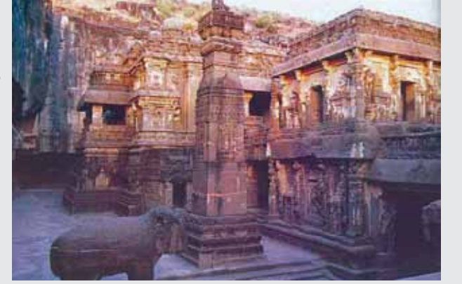
ಕೈಲಾಸನಾಥ ದೇವಾಲಯ, ಎಲ್ಲೋರಾ, ಮಹಾರಾಷ್ಟ್ರ

ಗಂಗವಾಡಿಯ ರಾಜ್ಯಪಾಲನನ್ನಾಗಿ ಮರು ಸ್ಥಾಪಿಸಿದನು. ತನ್ನನ್ನು ರಾಜ್ಯದಲ್ಲಿ ನಿರ್ವಿವಾದಿತ ದೊರೆಯಾಗಿ ಗುರುತಿಸಿ ಕೊಂಡನಂತರ, ಗೋವಿಂದನ ಗಮನವು ಉತ್ತರದತ್ತ ತಿರುಗಿತು. ದಕ್ಷಿಣ ಗುಜರಾತಿನ ರಾಜ್ಯಪಾಲನನ್ನಾಗಿ ತನ್ನ ನಿಷ್ಠಾವಂತ ಸಹೋದರ ನಾದ ಇಂದ್ರನನ್ನು ನೇಮಿಸಿ ರಾಜ್ಯದ ರಕ್ಷಣೆಯನ್ನು ಅವನಿಗೆ ಒಪ್ಪಿಸಿದನು. ವತ್ಸರಾಜನ