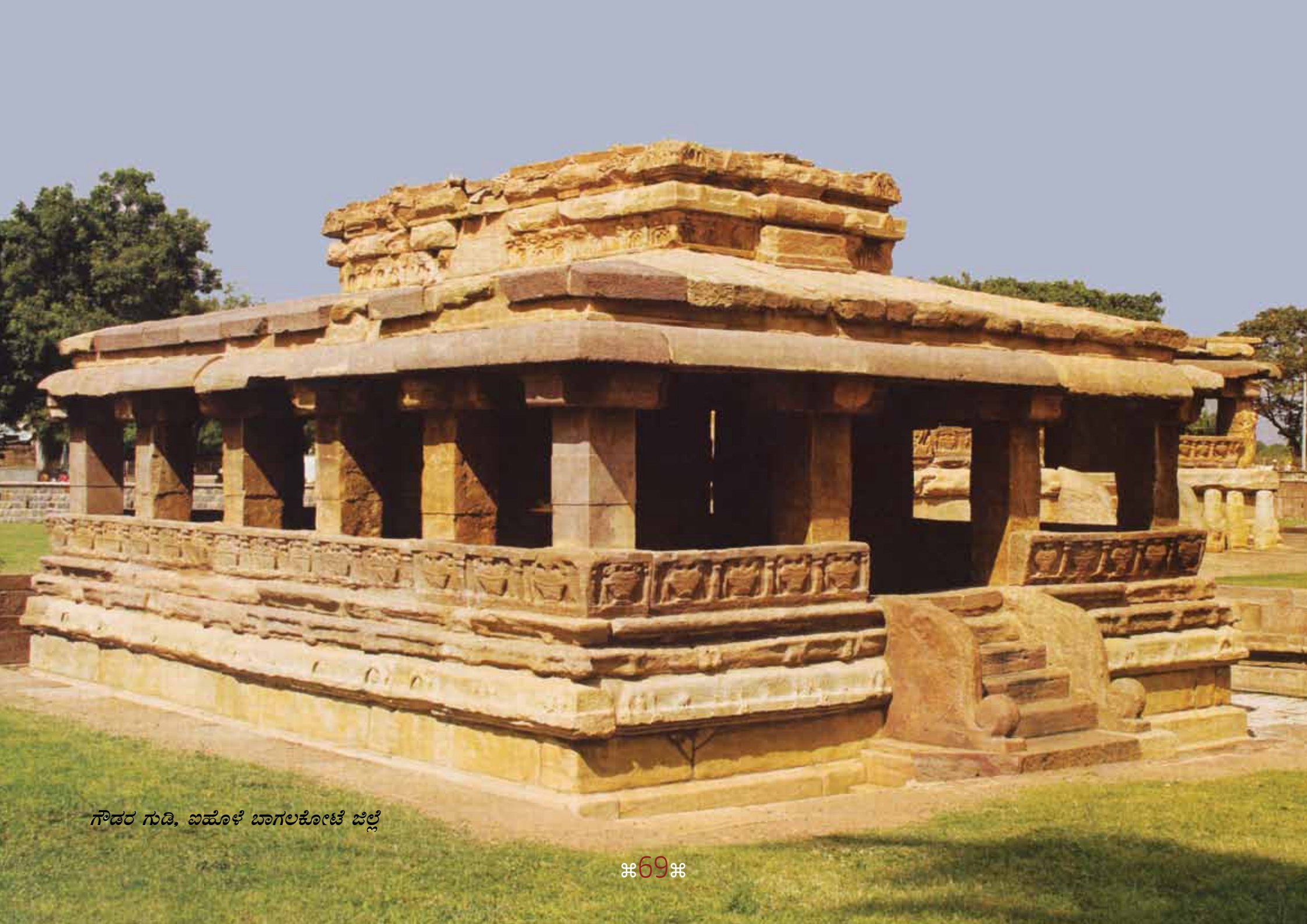
ಗೌಡರ ಗುಡಿ, ಐಹೊಳೆ ಬಾಗಲಕೋಟೆ ಜಿಲ್ಲೆ