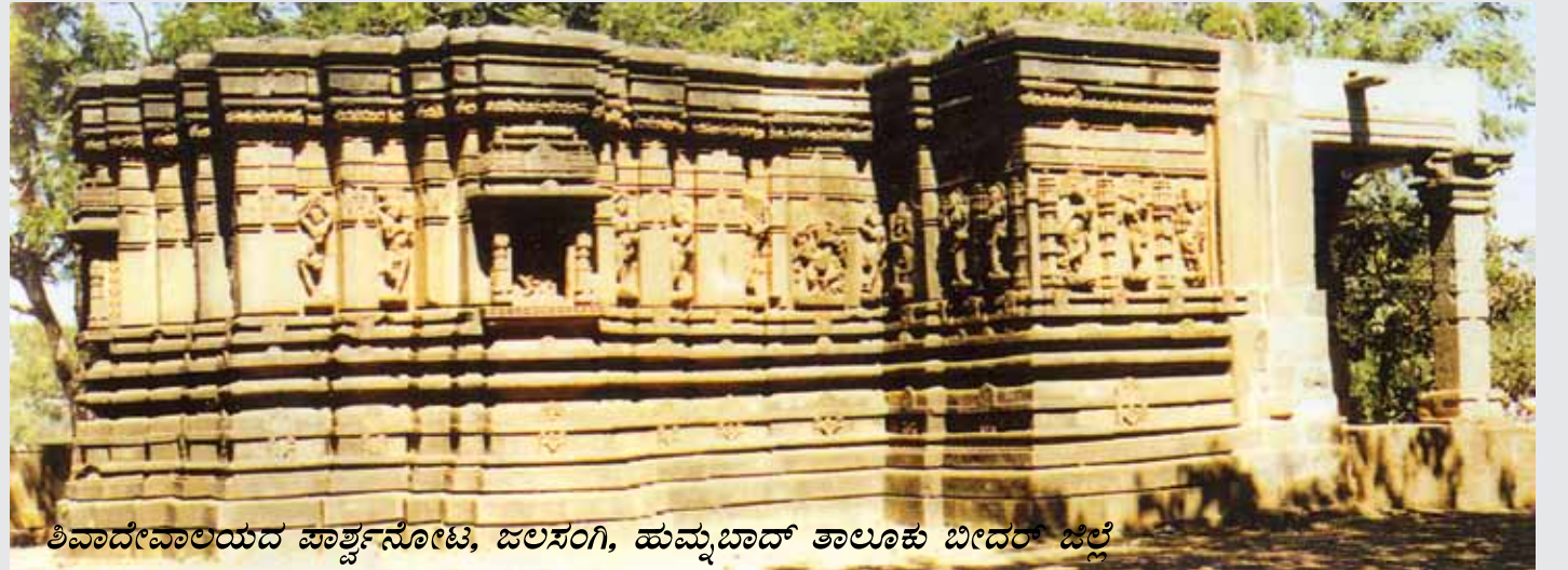
ಶಿವಾದೇವಾಲಯದ ಪಾರ್ಶ್ವನೋಟ, ಜಲಸಂಗಿ, ಹುಮ್ಮಬಾದ್ ತಾಲೂಕು ಬೀದರ್ ಜಿಲ್ಲೆ

ಮಧ್ಯಪ್ರದೇಶವನ್ನು ಆಳಿದ ಕಲಚೂರ್ಯ ಕುಟುಂಬಕ್ಕೆ ಸೇರಿದವರು ಕಲಚುರಿಗಳು. ಕಾಲಾಂತರದಲ್ಲಿ, ತಮ್ಮ ಅಧ್ಯಕ್ಷವನ್ನು ಅರಸುತ್ತ, ಒಂದು ಕುಟುಂಬವು ಕರ್ನಾಟಕಕ್ಕೆ ವಲಸೆ ಬಂದಿತು. ಅವರು ಹೈಹಯ-ಕುಲಕ್ಕೆ ಸೇರಿದವರಾಗಿದ್ದು, ಅವರ ಮೂಲ ತಾಣವು ನರ್ಮದಾ ನದಿಯ ದಡದಲ್ಲಿದ್ದ ಮಹಿಸ್ವತಿ ಆಗಿತ್ತು. ಕಲಚೂರ್ಯ ಕುಟುಂಬದ ಪ್ರಾರಂಭಿಕ ಅರಸರ ಹೆಸರುಗಳು ಕ್ರಿ.ಶ. ೧೧ನೆಯ ಶತಮಾನದಿಂದ ದೊರೆಯುತ್ತವೆ. ಆರನೆಯ ಏಕಮಾದಿತ್ಯನ ಮೊಮ್ಮಗನು ಪರ್ಮಾಡಿಯ