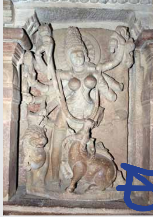
ಮಹಿಷಮರ್ಧಿನಿ, ಐಹೋಳೆ, ಬಾಗಲಕೋಟೆ