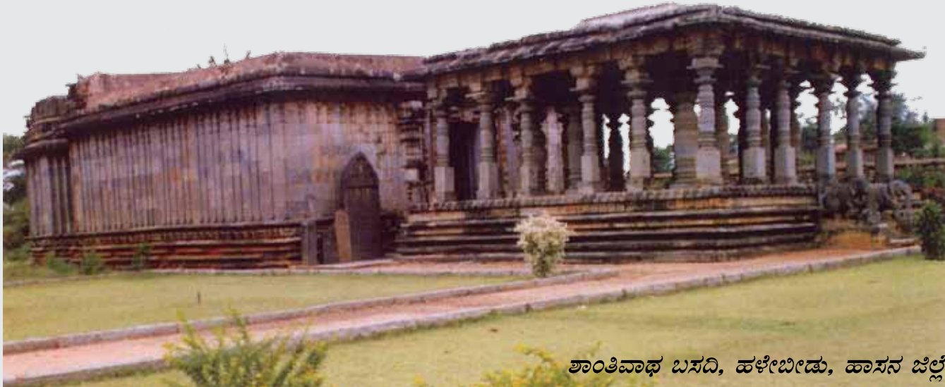
ಶಾಂತಿವಾಧ ಬಸದಿ, ಹಳೇಬೀಡು, ಹಾಸನ ಜಿಲ್ಲೆ

ಕ್ರಿ.ಶ.೧೨೯೫ರಲ್ಲಿ, ಸೇವುಣರ ರಾಜಧಾನಿಯಾದ ದೇವಗಿರಿಯ ಮೇಲೆ ಆಕ್ರಮಣ ಮಾಡಿದ ಅಲಾವುದ್ದೀನ್ ಖಿಲ್ಜಿಯು ಅಪಾರ ಸಂಪತ್ತನ್ನು ದೋಚಿಕೊಂಡು ಹೋದನು. ನಂತರ ಕ್ರಿ.ಶ.೧೩೦೧ ಹಾಗೂ ೧೩೦೨ರಲ್ಲಿ, ಹೊಯ್ಸಳರ ಮೇಲೆ ಧಾಳಿ ಮಾಡಿದನು. ಸೇವುಣರ ಪರವಾಗಿ ಆನೆಗೊಂದಿಯ ಮುಖ್ಯಸ್ಥನಾದ ಕಂಪಿಲದೇವ ಹಾಗೂ ಹೊಳಲೈರೆಯಲ್ಲಿ ತನ್ನ ಜೀವವನ್ನು ಕಳೆದುಕೊಂಡ ಹೊಯ್ಸಳ ಸೇನಾಧಿಪತಿಯಾದ ಸೋಮಯನ ನಡುವೆ ಯುದ್ಧ ನಡೆಯಿತು. ಕ್ರಿ.ಶ.೧೩೦೬ರಲ್ಲಿ, ರಾಜನ ನೇತೃತ್ವದಲ್ಲಿ ಹೊಯ್ಸಳ ಸೈನ್ಯವು ಲಕ್ಕುಂಡಿಯ ಕೋಟೆಗೆ ಲಗ್ಗೆ ಇಟ್ಟಿತು. ಹಾನಗಲ್‌ನ ಕದಂಬರ ಮುಖ್ಯಸ್ಥನಾದ ಕಾಮದೇವನೊಡನೆ ಸಿರಸಿಯಲ್ಲಿ ಕ್ರಿ.ಶ.೧೩೦೦ರಲ್ಲಿ ಒಮ್ಮೆ ಹಾಗೂ ಕ್ರಿ.ಶ.೧೩೦೨ರಲ್ಲಿ, ಹೊಯ್ಸಳರು ಯುದ್ಧ ಮಾಡಿದರು. ಸುಂದರ ಪಾಂಡ್ಯನ ಪರವಾಗಿ ಪಾಂಡ್ಯ ರಾಜಕಾರಣದಲ್ಲಿ ಮುಮ್ಮಡಿ ಬಲ್ಲಾಳನು ಮಧ್ಯಸ್ಥಿಕೆ ವಹಿಸಿದರೂ, ತನ್ನದೇ ರಾಜ್ಯದ ಉತ್ತರದಲ್ಲಿ ಎದುರಾಗಿದ್ದ ದಿಗಿಲು ಹುಟ್ಟಿಸುವ ಪರಿಸ್ಥಿತಿಯನ್ನು ಗಣನೆಗೆ ತೆಗೆದುಕೊಳ್ಳಲೇ ಇಲ್ಲ.