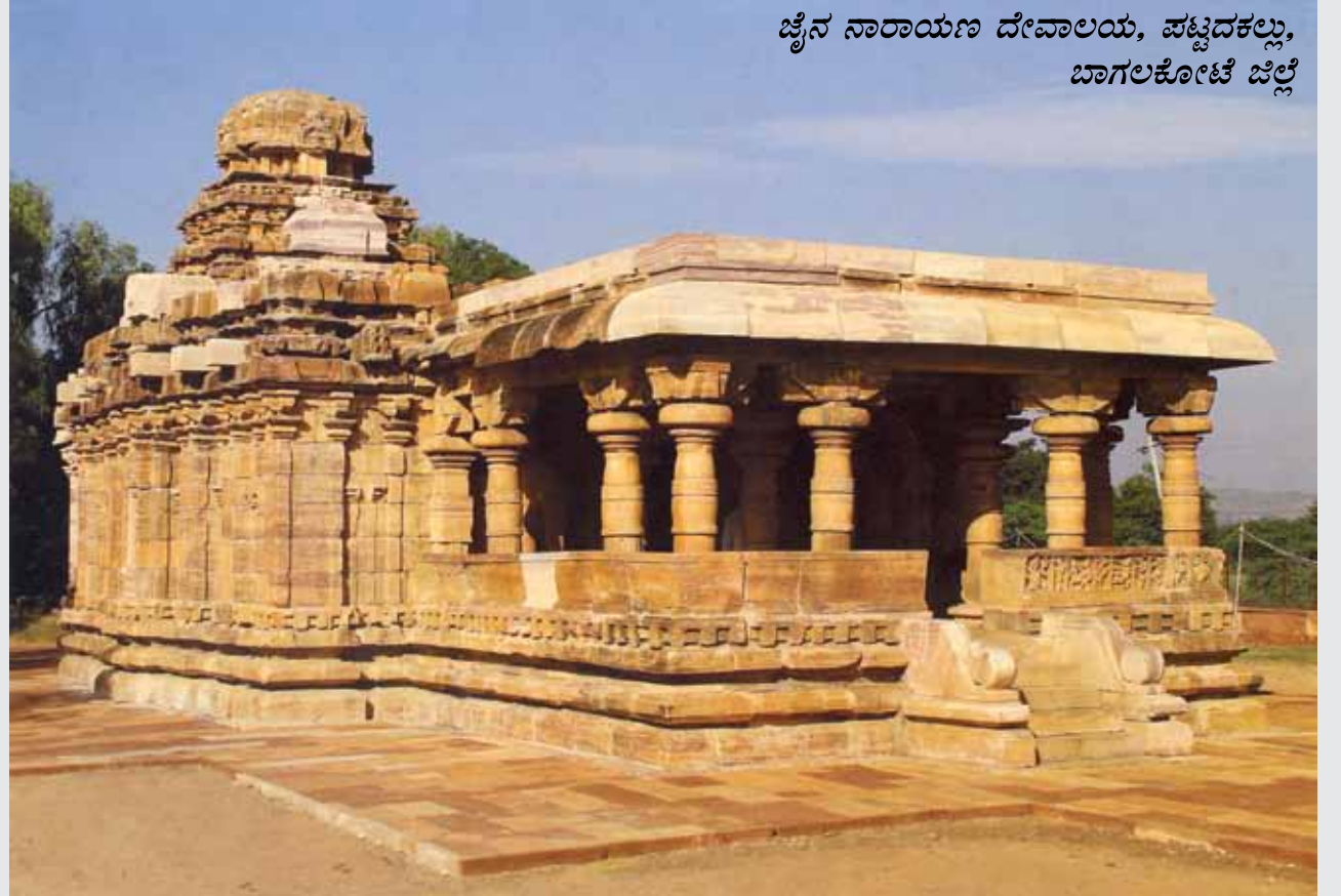
ಜೈನ ನಾರಾಯಣ ದೇವಾಲಯ, ಪಟ್ಟದಕಲ್ಲು, ಬಾಗಲಕೋಟೆ ಜಿಲ್ಲೆ

ಸನಪುಲ್ಲನನ್ನು ರಾಜನನ್ನಾಗಿ ಮರುಸ್ಥಾಪಿಸಿದನು. ರಾಷ್ಟ್ರಕೂಟರನ್ನು ಬಲವಾಗಿ ವಿರೋಧಿಸಿದ ಗಂಗ ಶ್ರೀಪುರುಷನನ್ನು ಎದುರಿಸಿದನು. ಆದರೆ ಅಂತಿಮವಾಗಿ, ಮೊದಲನೆಯ ಕೃಷ್ಣನು ಮೇಲುಗೈ ಸಾಧಿಸಿ, ಮುಂದುವರೆದು ಮಣ್ಣೆಯವರೆಗೆ ಬಂದನು. ಗಂಗರ ವಿರುದ್ಧ ಈ ಯುದ್ಧದಲ್ಲಿ, ಅವನ ಮಗನಾದ ಇಮ್ಮಡಿ ಗೋವಿಂದನು ಪ್ರಮುಖ ಪಾತ್ರವಹಿಸಿದನು. ಆತನ ಕರ್ತವ್ಯಪಾಲನೆಯಿಂದ ಉತ್ತೇಜಿತನಾದ ಕೃಷ್ಣನು ಕ್ರಿ.ಶ.೭೬೯ರಲ್ಲಿ ವೆಂಗಿ ರಾಜ್ಯದ ವಿರುದ್ಧ ಅವನನ್ನು ಕಳುಹಿಸಿದನು. ವೆಂಗಿ ರಾಜ ವಿಷ್ಣುವರ್ಧನನನ್ನು ಇಮ್ಮಡಿ ಗೋವಿಂದನು ಸೋಲಿಸಿದನು. ಹಾಗಾಗಿ, ರಾಷ್ಟ್ರಕೂಟರ ಮೊದಲನೆಯ ಕೃಷ್ಣನು ಕ್ರಿ.ಶ.೭೭೩ರಲ್ಲಿ ಮರಣ ಹೊಂದಿದಾಗ, ಆತನ ಮಗನಾದ ಇಮ್ಮಡಿ ಗೋವಿಂದನು ರಾಷ್ಟ್ರಕೂಟ ರಾಜನಾದನು. ಮೊದಲನೆಯ ಕೃಷ್ಣನ ಗಮನಾರ್ಹ ಸಾಧನೆಯೆಂದರೆ, ಭಾರತೀಯ ವಾಸ್ತು ನಿರ್ಮಾಣದಲ್ಲಿ ಅಭೂತಪೂರ್ವ ಪ್ರಯೋಗವೆಂದು ಪರಿಗಣಿಸಲಾದ ಎಲ್ಲೋರದ ಕೈಲಾಸ ದೇವಾಲಯದ ನಿರ್ಮಾಣ. ಈ ಗುಹಾ ದೇವಾಲಯವು ಮಾನವರ