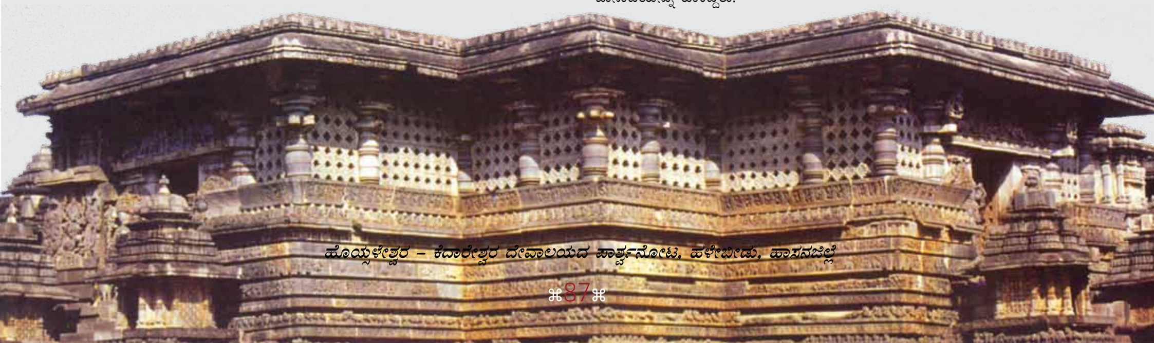
ಹೊಯ್ಸಳೇಶ್ವರ - ಕೆದಾರೇಶ್ವರ ದೇವಾಲಯದ ಸಾರ್ವಜನಿಕ, ಹಳೇಬೀಡು, ಹಾಸನಜಿಲ್ಲೆ

ಶಾಸನಗಳ ಪ್ರಕಾರ, ಸೆಪ್ಟೆಂಬರ್ ೮, ಕ್ರಿ.ಶ.೧೩೪೨ರಂದು ಬಲ್ಲಾಳನು ಕಾಲವಾದಾಗ, ಅವನು ಎಂಭತ್ತು ವರ್ಷಗಳ ಹಣ್ಣುಹಣ್ಣು ಮುದುಕನಾಗಿದ್ದನು. ಈತನ ನಂತರ, ಅವನ ಅಸಮರ್ಥ ಮಗನಾದ ನಾಲ್ವಡಿ ವಿರೂಪಾಕ್ಷ ಬಲ್ಲಾಳನು ಪಟ್ಟವೇರಿದನು. ಆತನೇ ಹೊಯ್ಸಳರ ಅಂತಿಮ ಅರಸನಾದನು, ಏಕೆಂದರೆ, ಆ ವೇಳೆಗಾಗಲೇ, ಹರಿಹರ ಸಹೋದರರು, ವಿಜಯನಗರ ಸಾಮ್ರಾಜ್ಯದ ಬುನಾದಿಯನ್ನು ಹಾಕಿದ್ದರು.